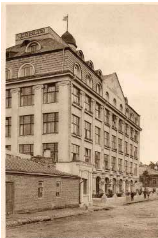
Собственный дом Центросоюза в Москве. Building belonging to Centrrosoyuz, Moscow. L'Immeuble du Centrrosoyuz à Moscou. Eigenes Gebäude des Centrrosoyuz, Moskau.